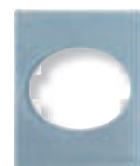
Cristal Azul (CA)